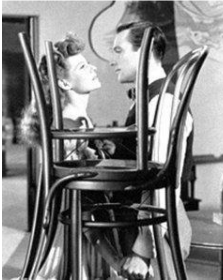
RITA HAYWORTH Y GENE KELLY