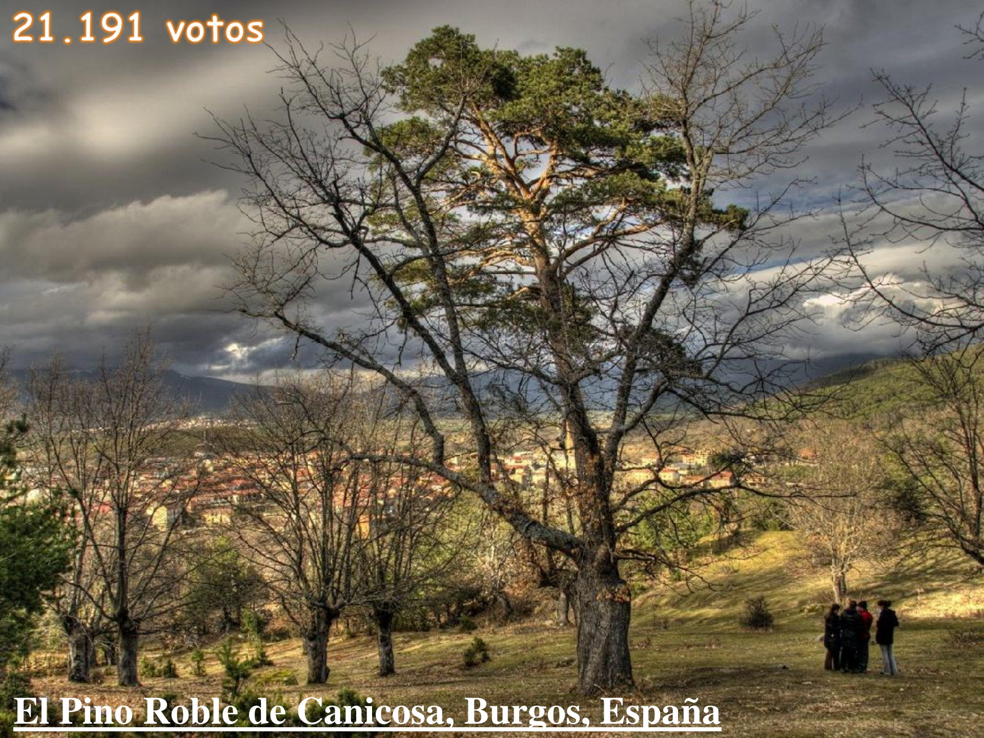
El Pino Roble de Canicosa, Burgos, España