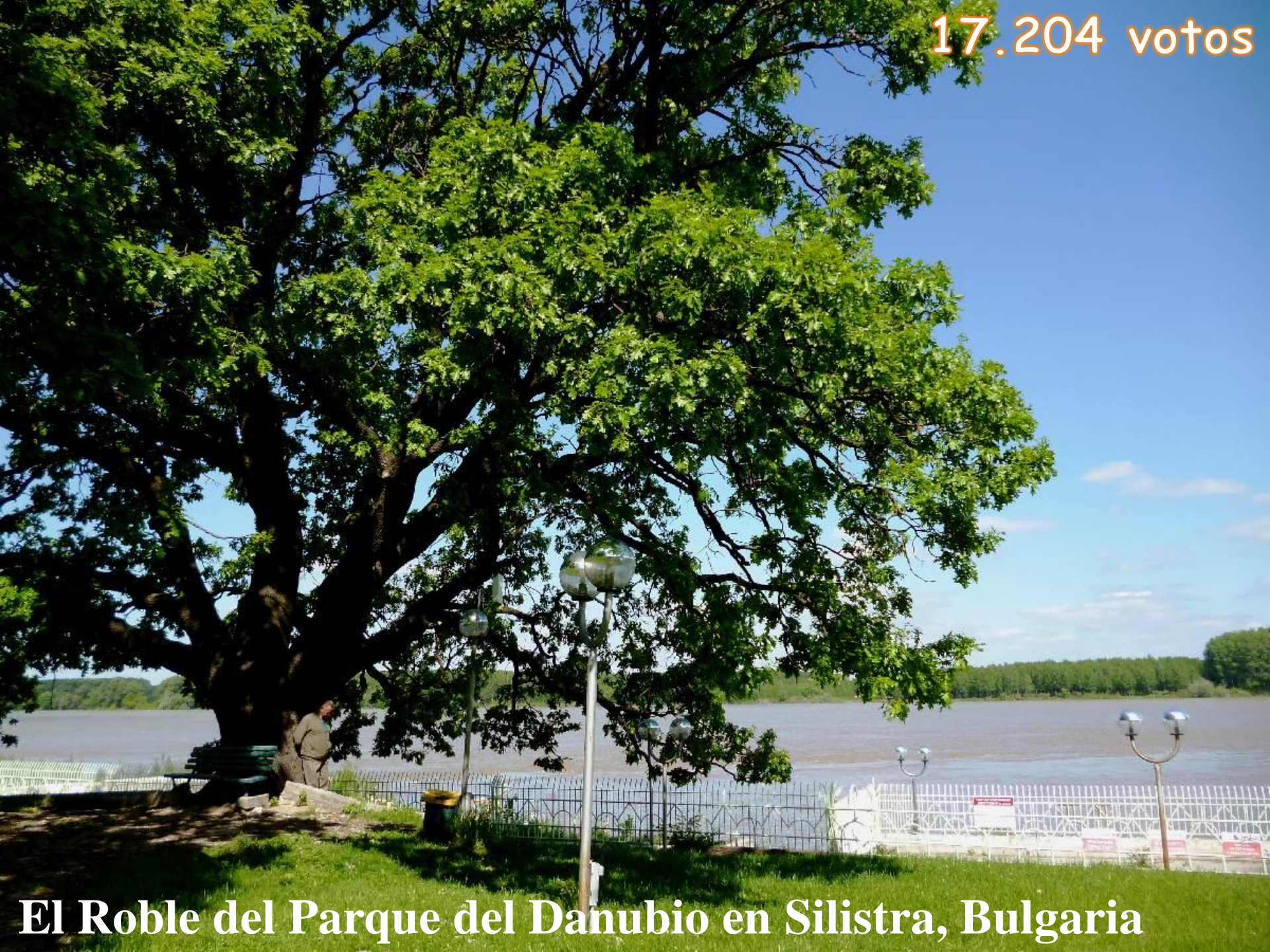
El Roble del Parque del Danubio en Silistra, Bulgaria