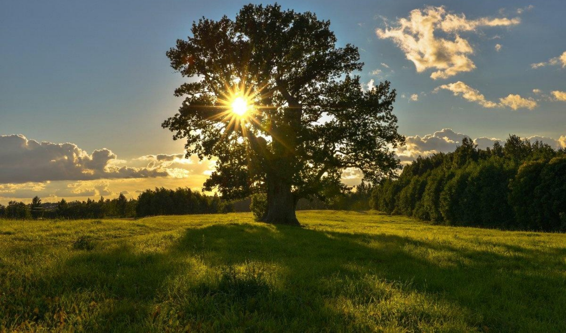
El Roble de Tamme-Lauri, Estonia