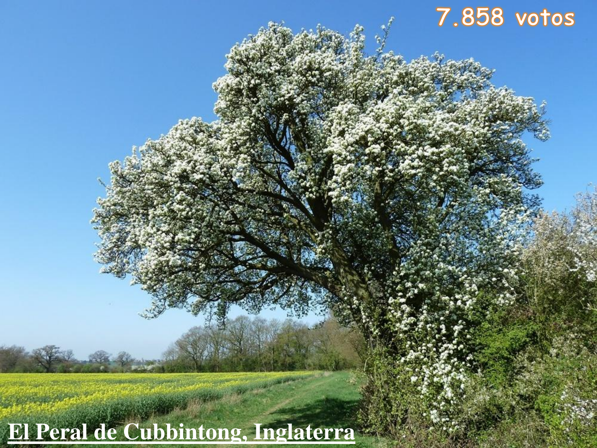
El Peral de Cubbintong, Inglaterra