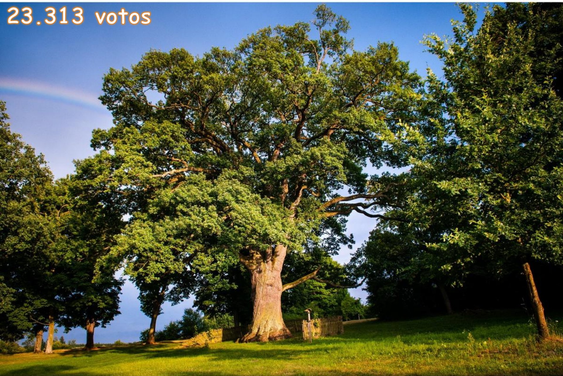
El roble Bolko, Polonia