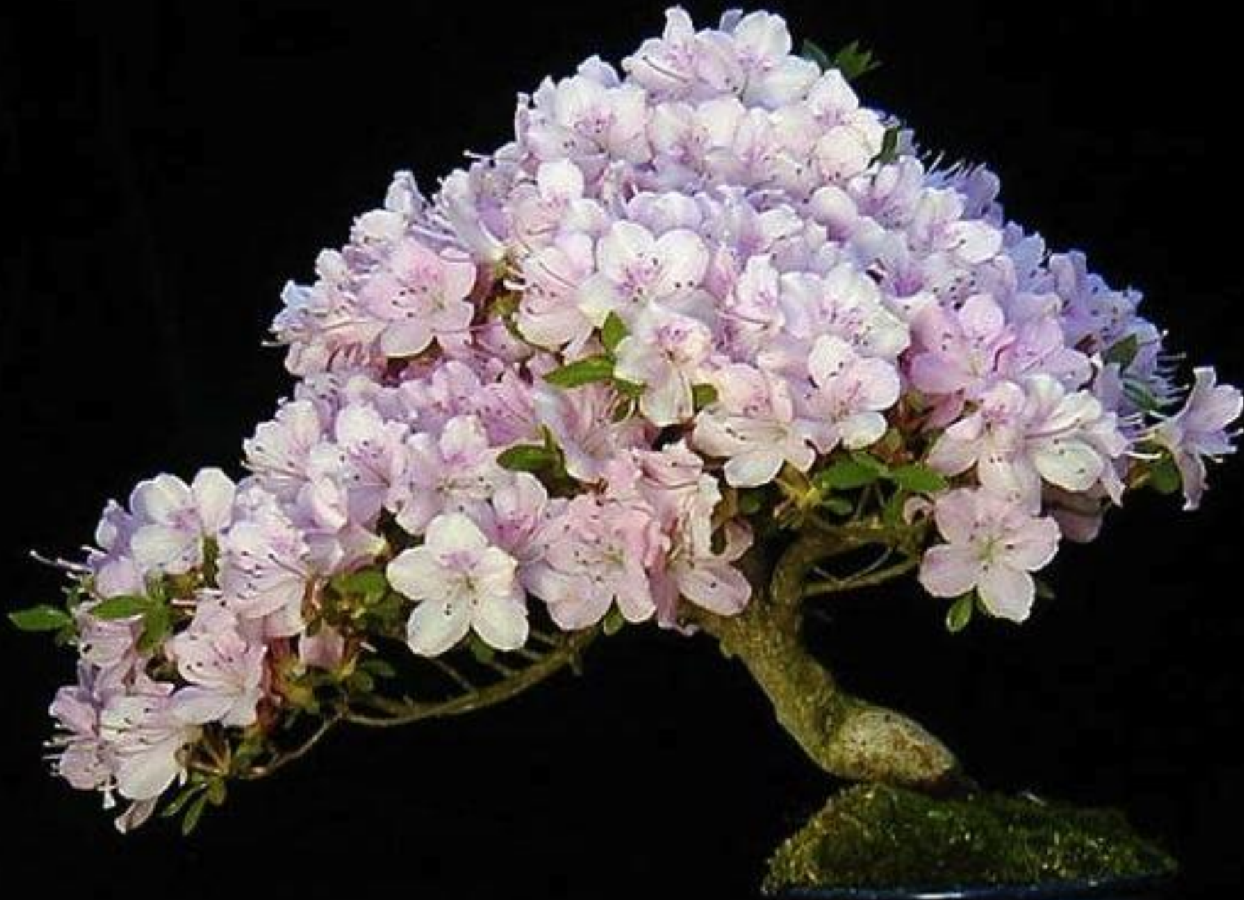
Bonsái de azalea en plena floración