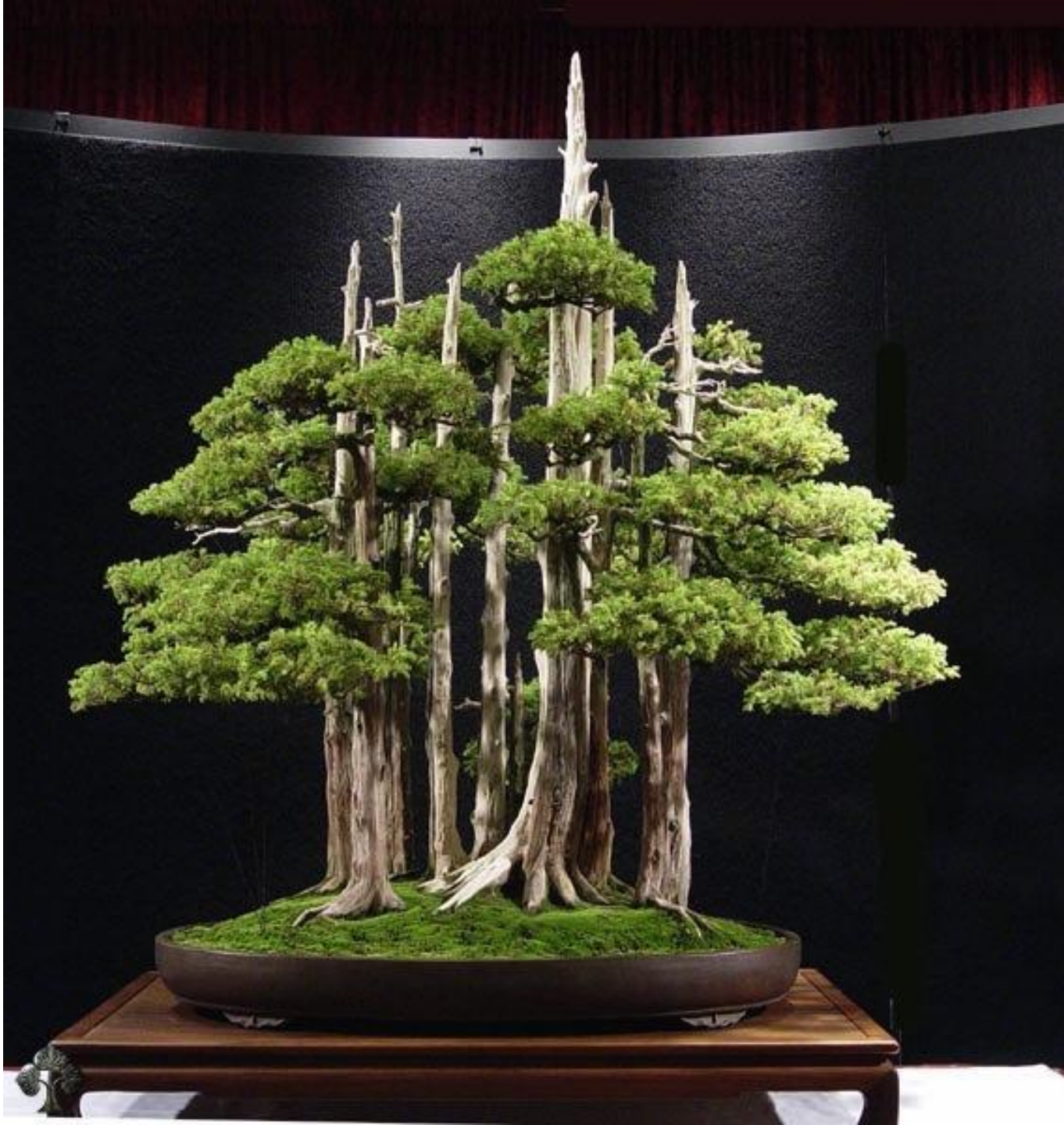
Goshin “protector de espíritus”