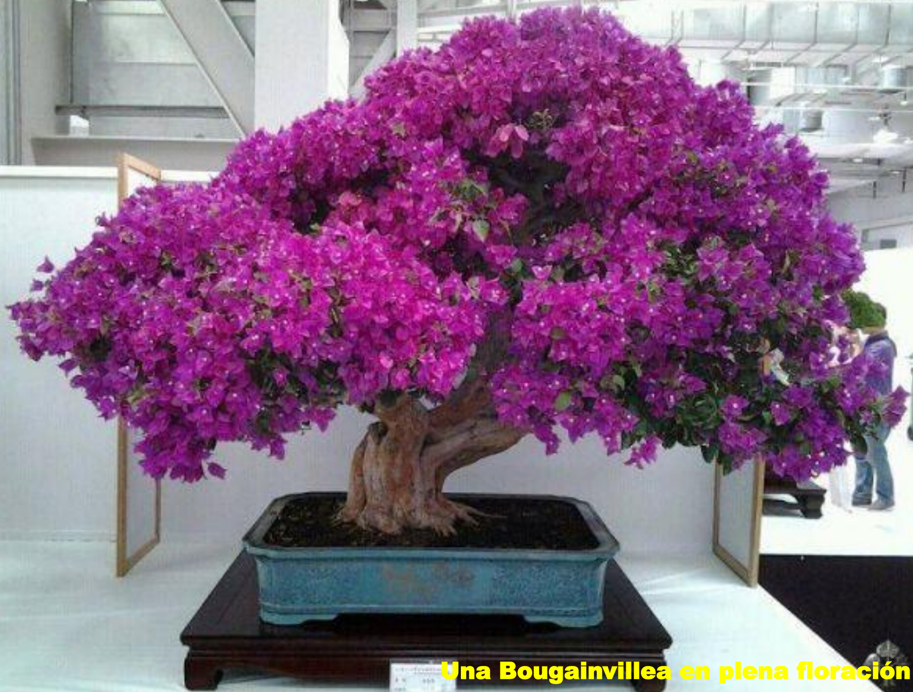
Una Bougainvillea en plena floración