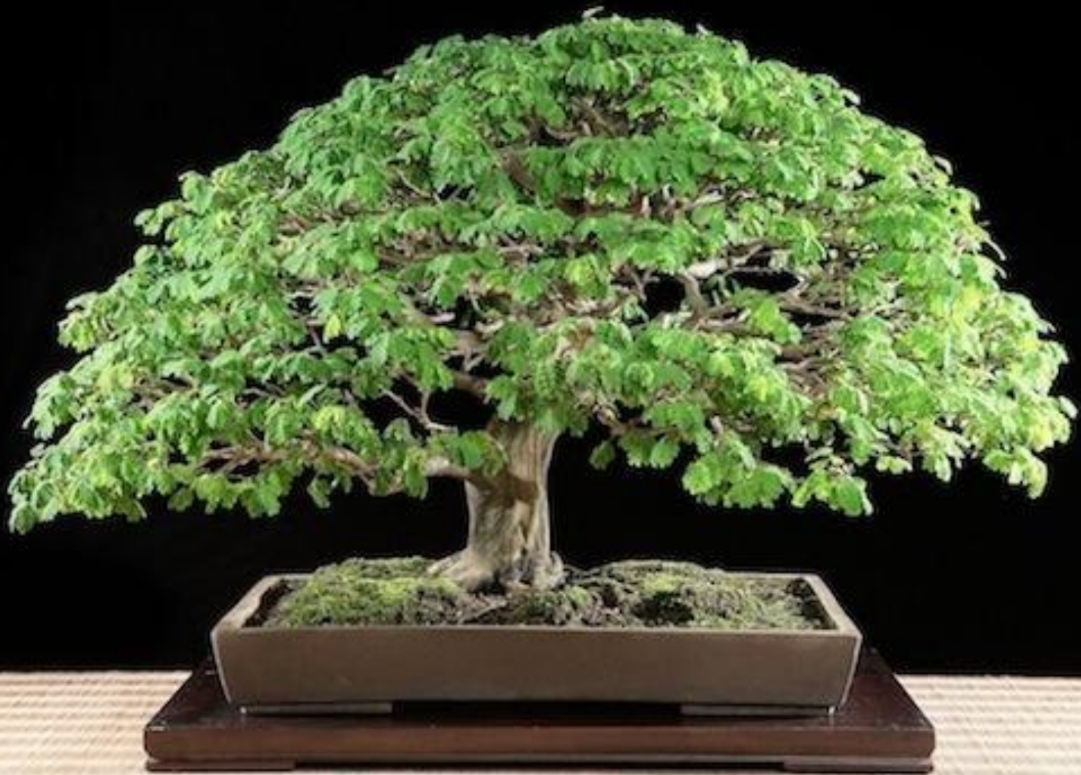
Árbol de lluvia brasileiro.