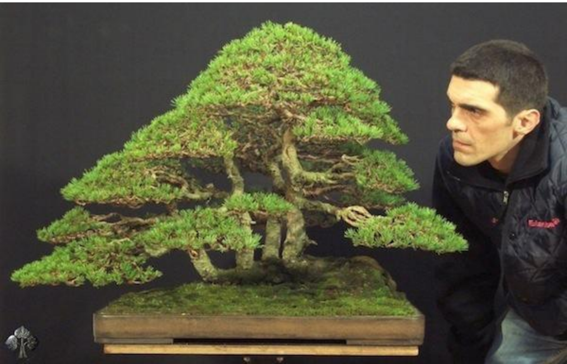
Un bonsái de Pino silvestre