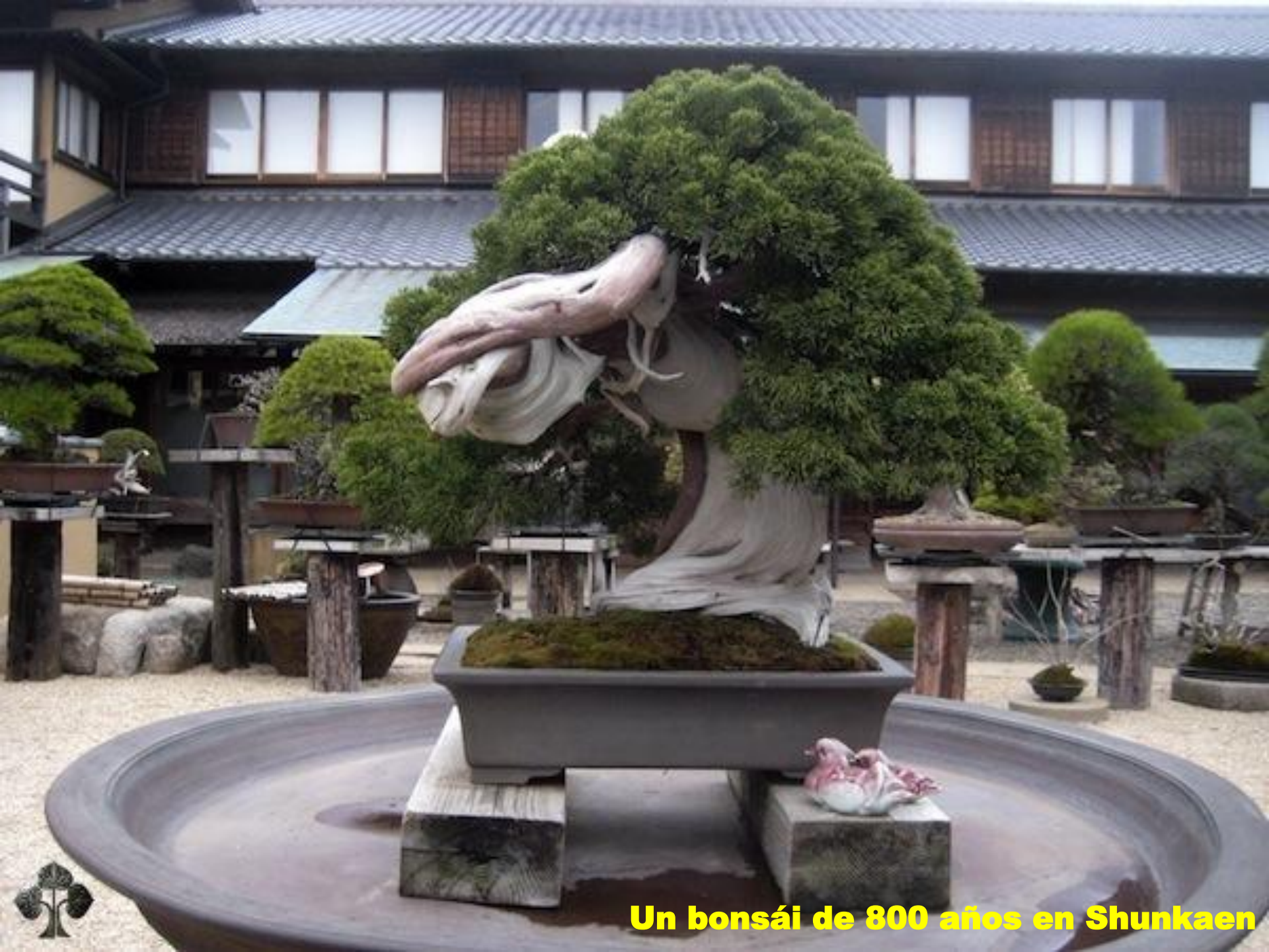
Un bonsái de 800 años en Shunkaen