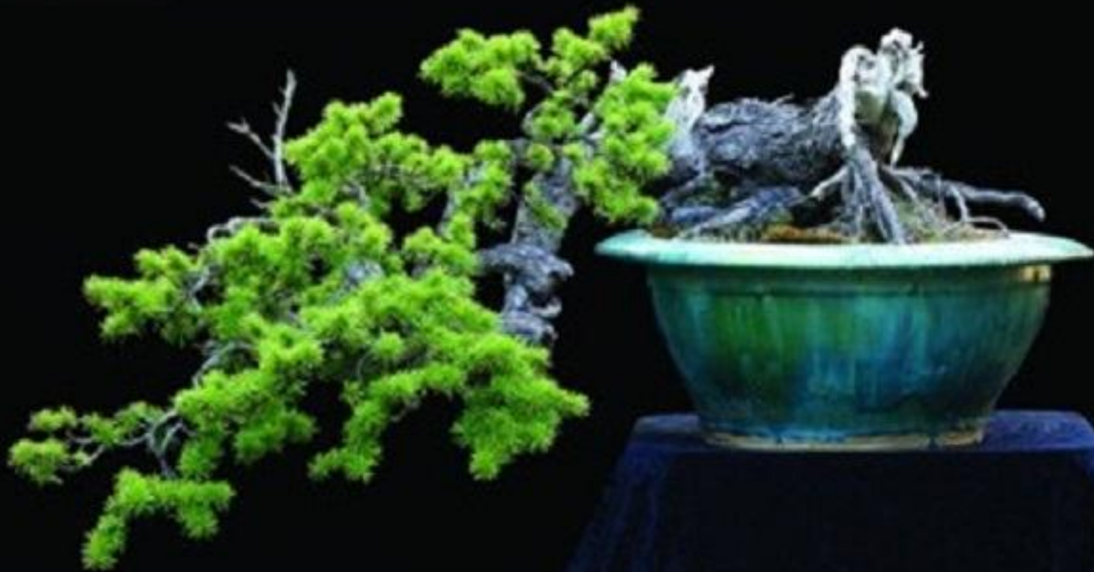
Un bonsái de Enebro en semi-cascada