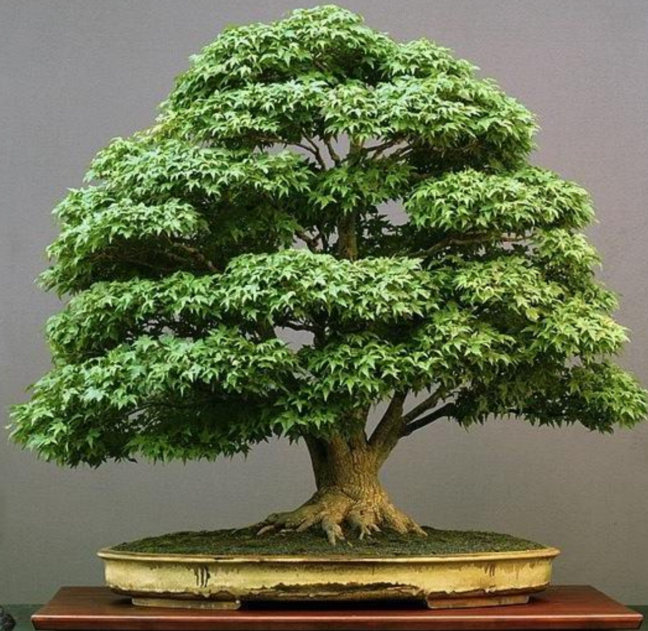
Un majestueux Arce japonés.